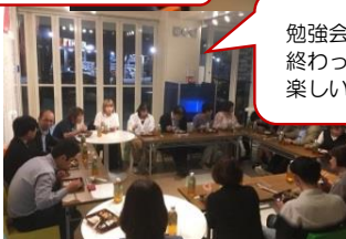
勉強会が 終わって 楽しい食事会