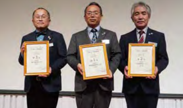
3位 長崎県諫早 1位 長崎県長崎南 2位 福岡県筑後