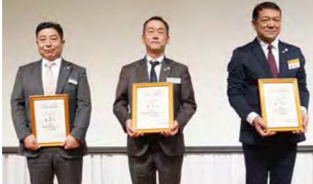
2位 佐賀県武雄市 1位 福岡県福岡市早良 3位 沖縄県八重山