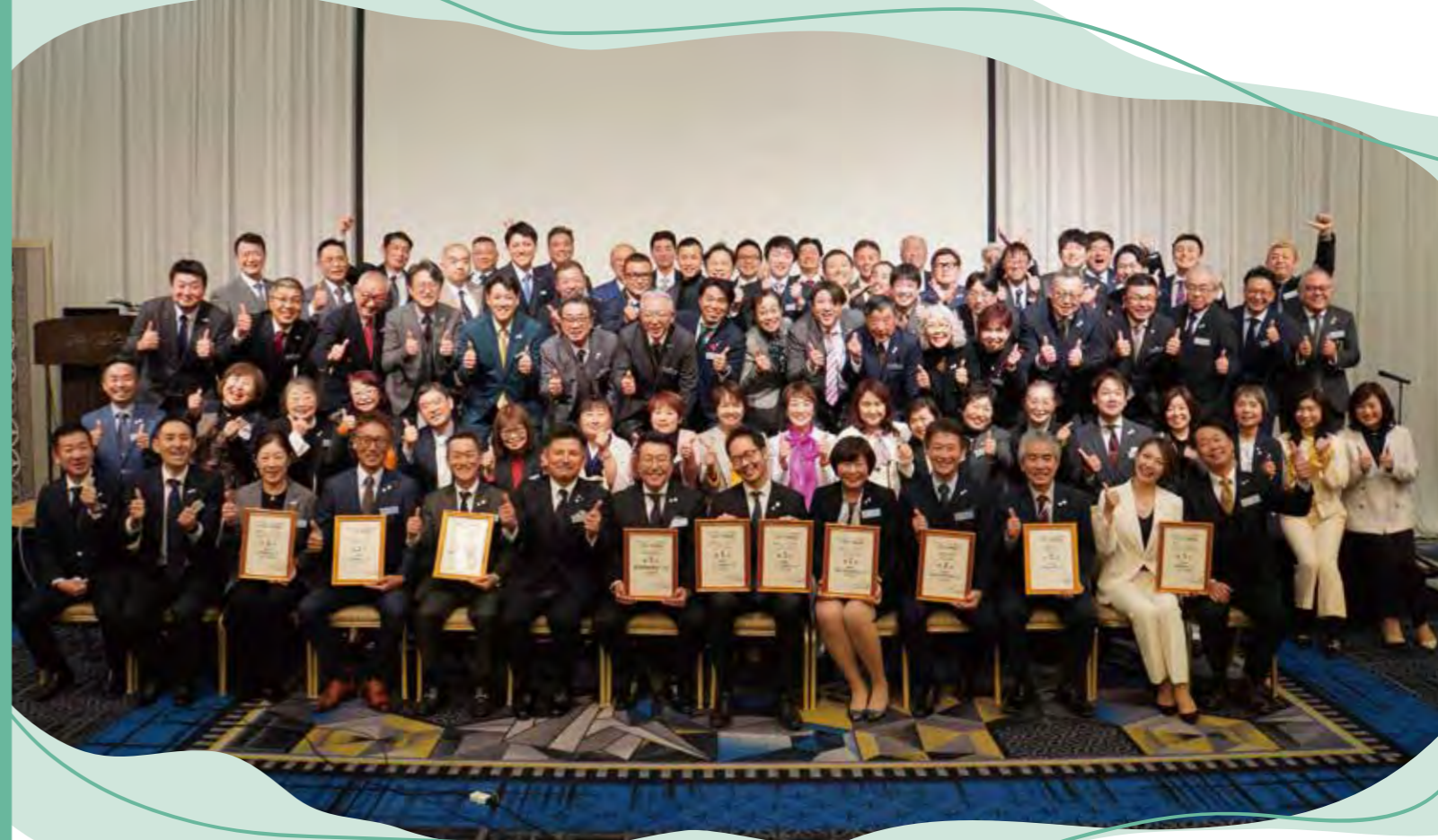
令和8年度 九州・沖縄方面 方面会