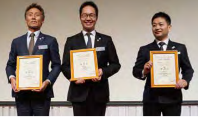
2位 福岡県伊都 1位 福岡県つくし 3位 熊本県合志市