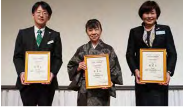
3位 鹿児島県薩摩川内市 1位 鹿児島県大隅 2位 福岡県福岡市城南