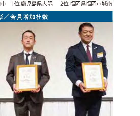
2位 佐賀県武雄市 1位 福岡県福岡市早良 3位 沖縄県八重山