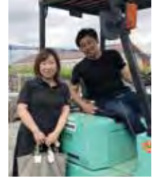
主人と一緒に職場での一枚

私の事業は主人が二代目を務める会社をサポートしたいと思って立ち上げた会社です。しかし、事業がうまくいかず主人にも迷惑がられ辛い日々を送っていました。そんな時に倫理指導を受け、話を聞いてくださっている間に主人を否定していた自分に気づき、こころから申し訳ないという気持ちになりました。指導の内容は「ご主人にきちんと謝りなさい」という事でした。勇気を出して三つ指をつき、これまでの自分の非を心から詫言いました。主人と心が一致しないまま過ごしてきたことへの反省も伝えました。すると数日後から主人が布団を用意してくれるようになり、感謝を伝え合う日々に変化しました。事業も良いご縁に恵まれ少しずつ前進し、今では主人も私の事業に協力してくれ、「一緒に発展して一緒に喜ぶ」一緒に苦難を乗り越えていけそうです。本当に倫理指導のお陰です。心に寄り添ってくださる倫理の先輩方に感謝しています。