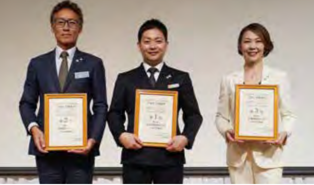
2位 福岡県伊都 1位 熊本県合志市 3位 福岡県大濠