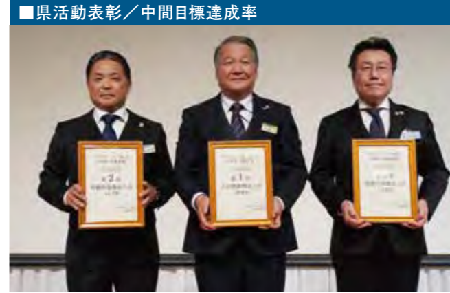
2位 沖縄県 1位 大分県 3位 福岡県