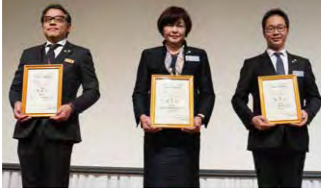
2位 熊本県熊本市中央 1位 福岡県福岡市城南 3位 福岡県つくし