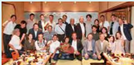
博多倫理法人会スローガン「縦糸と横糸を紡ぐ」

「縦糸と横糸を紡ぐ」をテーマに、記念式典では皆様へ感謝の想いをお伝え出来るよう、現役幹事一同、心を込めてお出迎えする所存です。 日時：令和6年7月24日(水) 受付 午後5時30分 開宴 午後6時～9時 場所：ホテル日航福岡 福岡市博多区博多駅前2丁目18-25 お問い合わせ：博多倫理法人会事務局 ☎092-406-5393