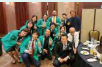
グループディスカッション後の懇親会