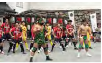
九州プロレスは各イベントのプロモーション活動にも出演!(ボルクバレット北九州の出陣式にて)