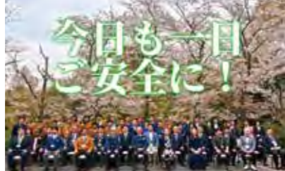
第62期経営指針発表会後の記念撮影

丸喜鋼業株式会社は、2007年にエコアクション21の認証を取得し、現在もその取り組みを継続しています。また、5年前には「北九州市環境にやさしい事業所」としても表彰されました。弊社の主な事業は鉄鋼製品の販売加工です。鉄は、様々な産業で不可欠な材料であり、その効率的な生産と使用は、持続可能な開発目標の達成に不可欠です。鉄の持続可能性とライフサイクルアセスメントから見て、地球上で最もSDGsに貢献できる材料の一つです。弊社は鉄の製造から廃棄までのプロセスにおいて環境への配慮を重視し、循環型経済の実現に向けて努力しています。また、鉄を通じて人々の幸福に貢献できる企業として日々精進しています。さらに、地域社会にも積極的に貢献し、地域のニーズに応じた取り組みや支援活動を通じて、社会的責任を果たしています。丸喜鋼業株式会社は、鉄を通じて人々の生活と環境にポジティブな影響を与えることに意欲を持ち、地域の持続可能な未来を築くために、SDGsの達成に向けた努力を支援し続けていきます。