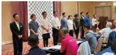
研修委員と講師の皆さん