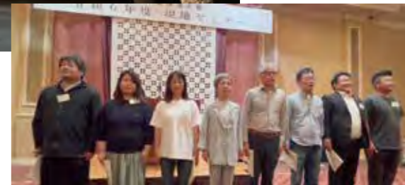
最後に決意発表をしました