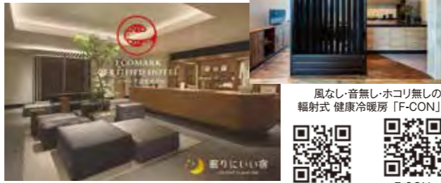
博多区店屋町「HOTEL GREAT MORNING」最高の目覚めをお届けします

弊社は総合健康提案企業として、「頑張らなくてもよい健康」を日常の様々な場面で提案しています。中でも私は風の吹かない輻射式の健康冷暖房「F-CON」に携わっています。F-CONの魅力は何とんでも無風の心地よさ。風のある環境では、人は交感神経が高まり、睡眠時の覚醒頻度も増加すると言われています。一方、無風環境では、「脳科学的にリラックスされた空間」ということが証明されました。(九州大学と共同研究)また、エアコンと輻射式のF-CONでは、体感温度が3℃上昇するという結果も得られ、(自社調べ) エアコンよりも冷暖房の室温設定温度を低く/高くしても快適性は担保され、その分、省エネになります。また、弊社は博多区店屋町で全館にF-CONを採用したホテル「GREAT MORNING」を営業しています。ここでも環境を意識した様々な取組を行い、各種の旅行予約サイトでも高い満足度評価(福岡県第1位)をいただいております。これからも人と環境に優しい健康的な提案を続けて参ります。