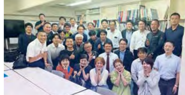
朝礼委員の皆さん

昨年に引き続き、今期で2年目の県の朝礼委員長を務めさせてもらっております。今年度は昨年度以上に、会員企業様から「朝礼指導をお願いします」という依頼が増えました。朝礼委員会では、委員さんと共に会員企業を訪問し、活力朝礼のやり方や活力朝礼の効果をお伝えする活動を行っています。去年と今年で、朝礼を導入に関わらせてもらった企業さんを客観的に見ると、社員や会社が明るくなり、変わっていくのが分かります。今期のスタートで、76社の活力朝礼の普及目標をたて、目標達成するペースで進んでいます。たくさんの喜びの声をいただき、幸せな気持ちになっております。この激動の世の中を、活力朝礼を取り入れ、みんなで乗り越え、福岡を、日本を元気にしていきたいと思っております。