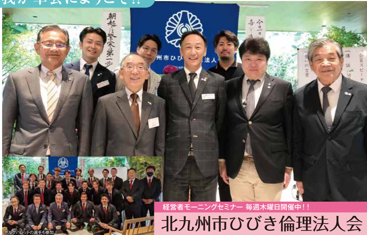
経営者モーニングセミナー 毎週木曜日開催中!!