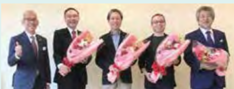
伊都倫理法人会歴代会長

日時：令和6年8月7日(水) 受付 午後5時30分 記念式典 午後6時～ 場所：割烹旅館 山水荘 福岡市西区泉1丁目5-1 お問い合わせ：伊都倫理法人会事務局 ☎092-406-4406