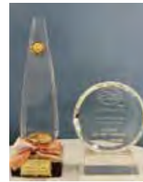
北九州市環境にやさしい事業所に選出されました!