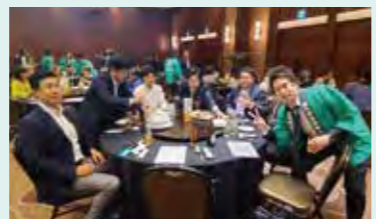
グループディスカッションの中間