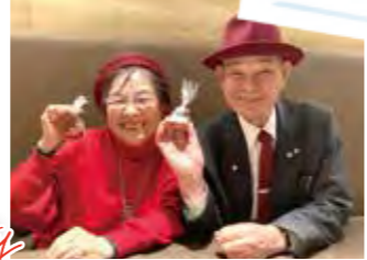
新会員さんをお招きして、 月に1回ランチを一緒にしています♪

博多みなと倫理法人会は設立12年。 「みなとで話すと話しやすい!」 「活気があって聞く姿勢も素晴らしい!」 たくさんの皆さまに嬉しい 言葉をいただきました。 20代から70代の様々な境遇、 お立場の方々が経営者モーニング セミナーや講座などで 学びあっています。 今後も会員さんや他の単会の 皆さまからも愛され続ける 博多みなとを目指して まいります。