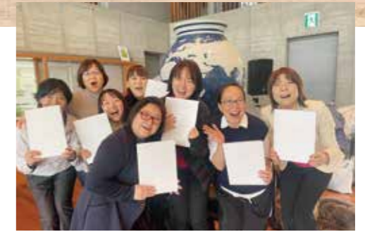
無事修了証いただきました