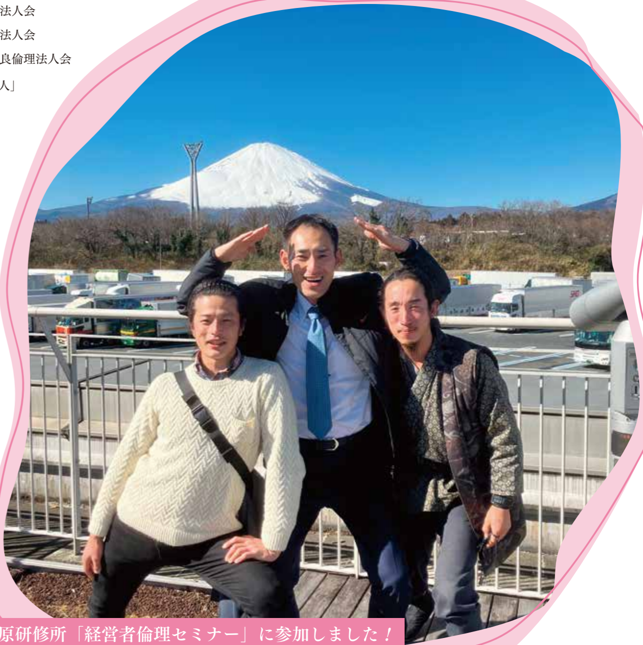
富士高原研修所「経営者倫理セミナー」に参加しました!