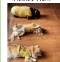
ワンコと日向ぼっこ

店舗での切り花、苗、鉢植えの販売、個人宅を中心に庭やベランダのガーデニングと個人宅への定期デリバリーと来店型サブスクを行い、植物から季節を知り愉しむライフスタイルの提供を行なっています。現在、高齢者を中心に見守りサービスを街単位で、街ぐるみで花の定期デリバリーを通して行うプロジェクトをすすめています。『尊己及人』アンズガーデンの理念を常に考え、己のすべき事を追求し社会貢献につながることを喜びとし活動しています。