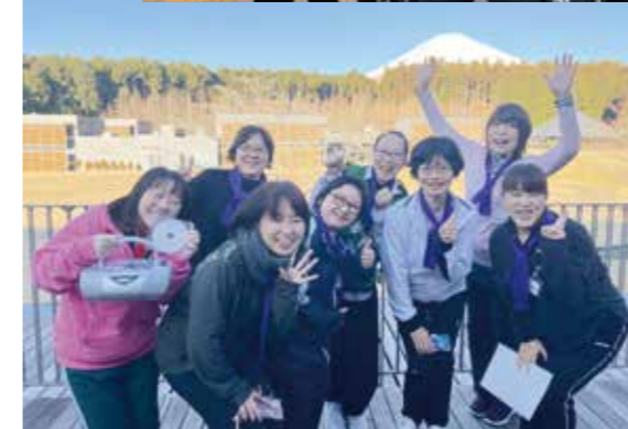
チーム丸となって苦手チャレンジ実践中！