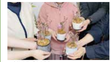
一寸桜盆栽づくり講座

店舗での切り花、苗、鉢植えの販売、個人宅を中心に庭やベランダのガーデニングと個人宅への定期デリバリーと来店型サブスクを行い、植物から季節を知り愉しむライフスタイルの提供を行なっています。現在、高齢者を中心に見守りサービスを街単位で、街ぐるみで花の定期デリバリーを通して行うプロジェクトをすすめています。『尊己及人』アンズガーデンの理念を常に考え、己のすべき事を追求し社会貢献につながることを喜びとし活動しています。