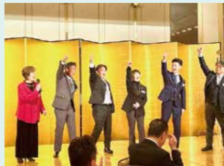
各単会の決意表明