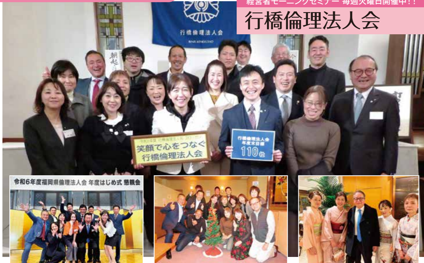
令和6年度福岡県倫理法人会 年度はじめ式 懇親会