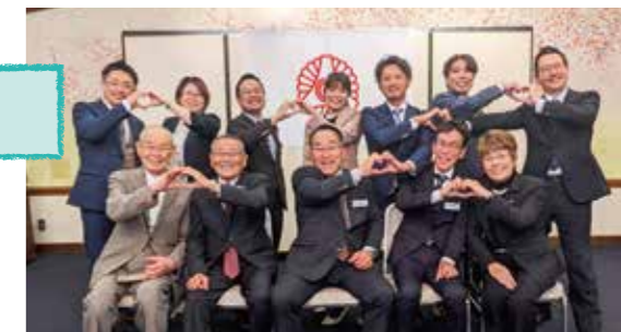
第10期後継者倫理塾スタッフ勢揃い

後継者倫理塾とは「創業者の精神を引継ぎ、倫理経営を正しく理解・実践し、健全な経営を推進する企業の未来を担う後継者の育成を目的」としています。今期で第10期となり10月より1泊2日の10ヶ月の研修を16名の塾生が『万人幸福の葉』を基に学び(インプット)、日常生活で実践(アウトプット)を通して倫理体験を積み、経営者としての器を創るため努力しております。12月1～3日には富士高原研修所に塾生全員が参加し、親祖先や配偶者への『恩の自覚』をすることでスナオになり自己革新のきっかけを掴んでいます。残り6ヶ月実践実践また実践で、7月11日の研究発表には後継者(経営者)としての自覚と決意を発表することになります。これからは本番です。福岡県の皆さんの単会で後押しを宜しくお願い申し上げます。