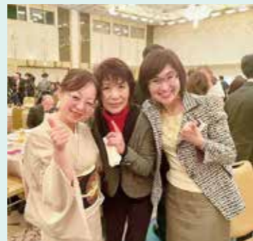
会員同士の積極的な交流