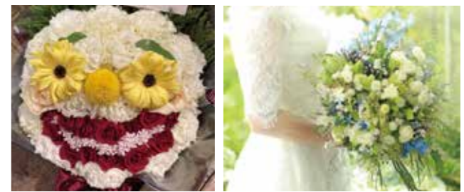
THE BIG SMILE GIFT THE WEDDING BOUQUET

企業理念は「お客様の気持ちに寄り添ったお花の作品制作」です。「尊己及人」自己の個性(たち)を出来るだけのばして、世のため人のために働くことに全力で取り組んでいます。お花は人の心を大きく動かせる不思議なパワーがあります。私はその自然の生命体の美しき力を多くの人々へお伝えしたいと考えています。