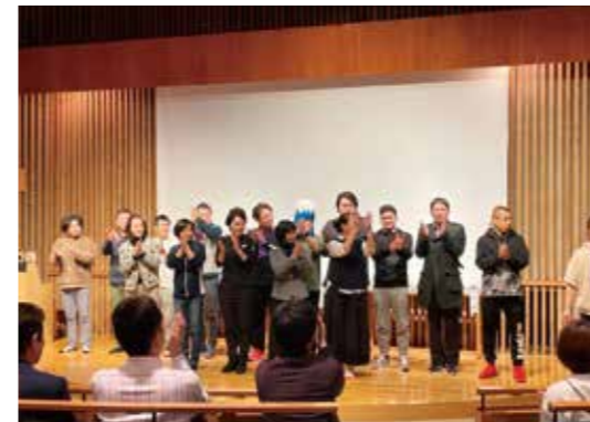
研修修了間近！リーダー集合！！