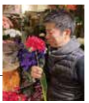
お花が大好きな私