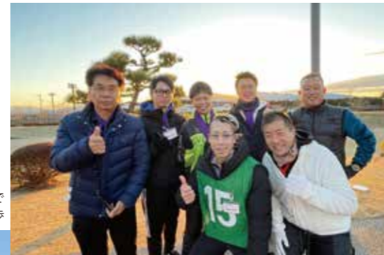
グループで朝の散歩