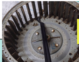
ビフォー アフター

また、お掃除を通じて感じることは、お客様の喜びは勿論ですが、お家も喜んでくれるようです。