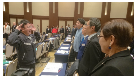
チームに分かれて素直五態の実践。見るとやるのとでは大違い。みなさん顔に汗しながら一生懸命に取り組んでおられました。