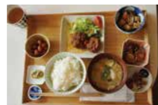
キッチン陽より子のランチ