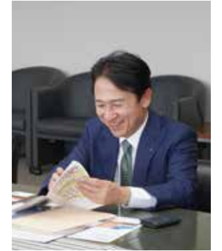
終始笑顔の武内市長