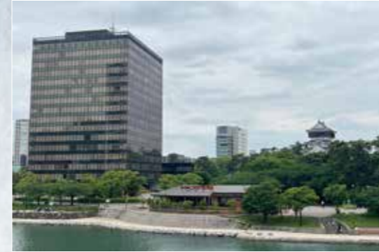
北九州市役所と小倉城