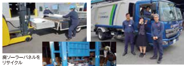
廃ソーラーパネルをリサイクル

昭和56年に古紙回収業者としてスタートしました。事業を続けていく中で、お客様より紙類以外の廃棄物処理の相談を受ける事も多くなり、処理できる品目も徐々に増えていきました。弊社では全ての物をリサイクルする《トータルリサイクル企業》を目指して経営しております。地域のお客様との繋がりは行政のHPや口コミなどになりますが、ポイントを貯めて景品と交換できることも〈喜びの声〉として頂いております。自社の経営方針である「これから生まれてくる子ども達の為に、地球に優しい企業を目指し、リサイクル業を通じて、ゼロエミッション、資源の有効活用、廃棄物の抑制、大気などの汚染を予防し、社会に貢献いたします」の部分は、各々の役割を果たす事でSDGsの達成に繋がるものと捉え、これからも社員一丸となって貢献して参ります。最後になりますが、工場見学も随時受け入れておりますので、是非一度足を運んでみて下さい。