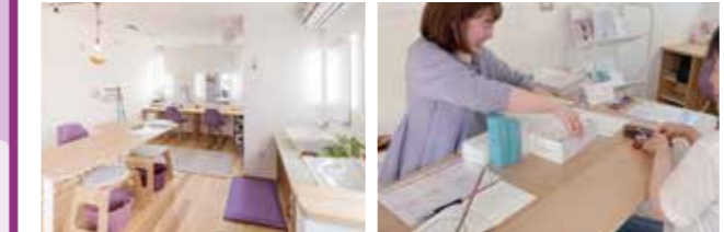
アットホームなサロン内