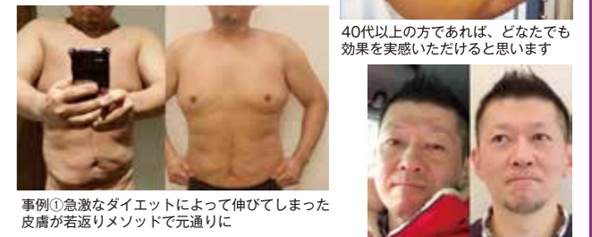
40代以上の方であれば、どんなでも効果を実感いただけると思います