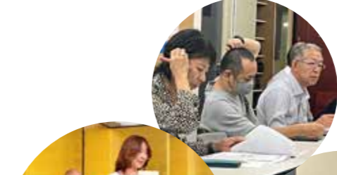
「いただく」は 全てひらがなへ