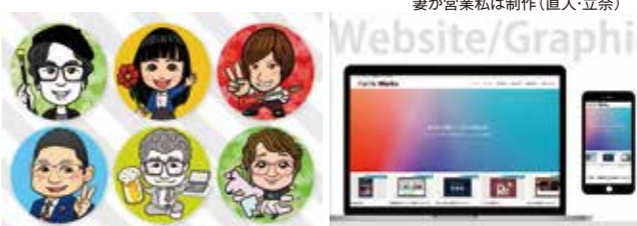
SNSアイコンにもおすすめの似顔絵 私たちのホームページ

東京都、福岡県を中心に、ホームページ、グラフィックデザイン、イラスト制作で「事業活動の信頼づくり」をサポートしています。倫理法人会に出会ってから『万人幸福の架』が人生のバイブルです!お客様の想いが輝き、必要な人に届き、しあわせの輪が広がること。そんな想いを込めて、成長を忘れず、丁寧にお仕事させていただきます。