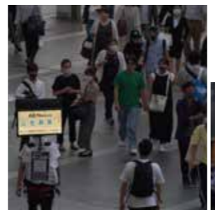
歩く広告稼働風景

前後2画面のモニターを頭上に背負い、依頼主の流したい映像を流しながら街中を歩きます。依頼主の成果目的に合ったプランと一緒に考え、成果目標達成に向けて丁寧に稼働いたします。「人生は神の演劇、その主役は己自身である」とあるように、歩く自身と、モニターに映す依頼主の映像が主役となるよう尽力いたします。