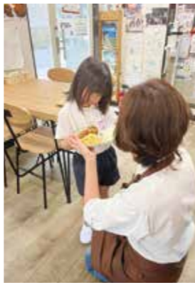
傷を抱えた子どもも美味しいカレーで心も身体も温かくなる