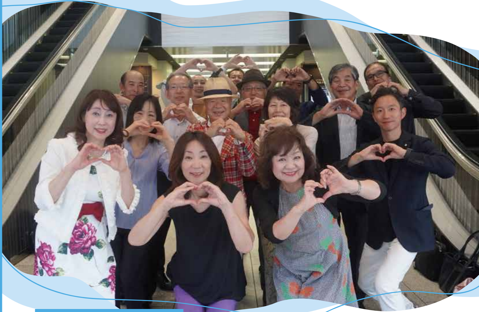
福岡県倫理法人会 広報委員会

エキスパートに聞いてミタ! 任期満了 令和5年度 県三役お疲れ様でした!! 広報委員会 NEWS