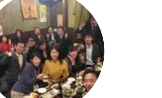
土木も建設業に入るよね