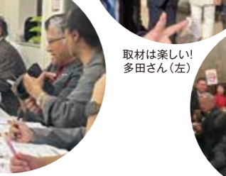
広報委員会 普及目標見事達成！