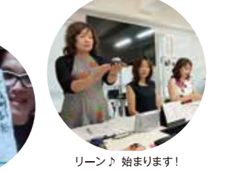
リート 始まります！