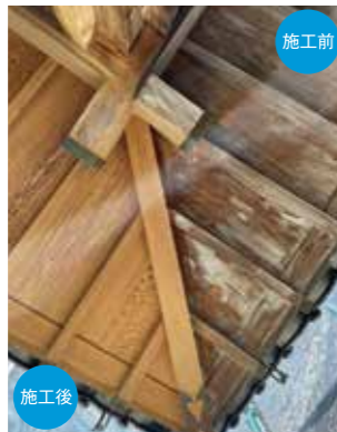
長年の木材建造物に付着した汚れもこの通り!