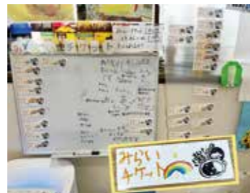
みらいチケット1枚でこどもカレー1杯が食べられるよ!

「お腹いっぱいならケンカせん」。食堂を営む亡き父にそういわれて育って来た私は、何を決意したからでもなく、誰から言われたからでもなく、自然の流れで、こども食堂をスタートさせました。現実には、給食しか食べられない子、ネグレクト、貧困と小さな胸に大きな傷を抱えている子がほとんどです。特にどの子も自分をこんな環境においた「親」を憎んでいます。今の私にできる役目は、「お腹を満たす事」、「命の本（もと）」である両親が、あって今の自分の命がある事を子ども達に伝える事です。有難いことに、商品にならない食材を提供していただいたり、お客様から1枚200円で「みらいチケット」をご購入いただいたり運営ができています。私の最終の願いは、温かいご飯を家で食べる事のできる、こども食堂なんて必要のない未来になる事です。どのお家の子も、平等に幸せに生きていける世の中になりますように。