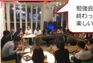
勉強会が 終わって 楽しい食事会