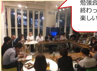
勉強会が 終わって 楽しい食事会

学ぶための形として 一般的には、講師の話をしきり形が多い中、倫理学習会は、1つのテーマについて、グループディスカッションをしたあと、発表者がまとめます。自分の中にある考え方・価値感をアウトプットすることで、気づきと学びになります。